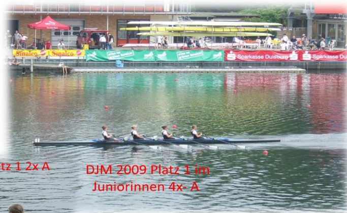
DJM 2009 Platz 1 im Juniorinnen 4x- A