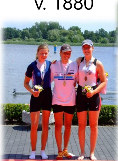
2007 DJM Brandenburg Platz 1 im Juniorinnen 1x B