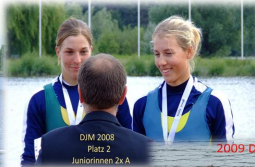
DJM 2008 Platz 2 Juniorinnen 2x A