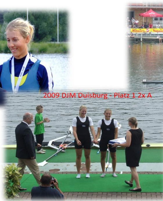
2009 DJM Duisburg - Platz 1 2x A